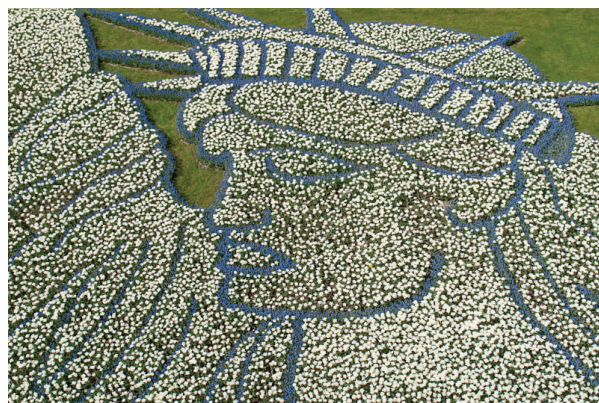
Vrijheidsbeeld in de bloei.