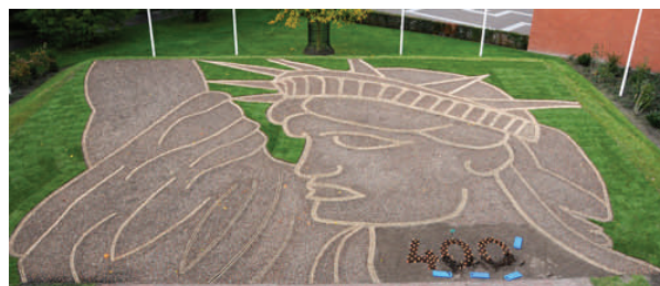
Vrijheidsbeeld voor de bloei.

Dit is een gegeven dat bij de Amerikaanse overheid hoog in het vaandel staat. Dit bondgenootschap uit zich o.a. in het samen strijden in Afghanistan voor een wereld waarin vrijheid en mensenrechten verdedigd worden.