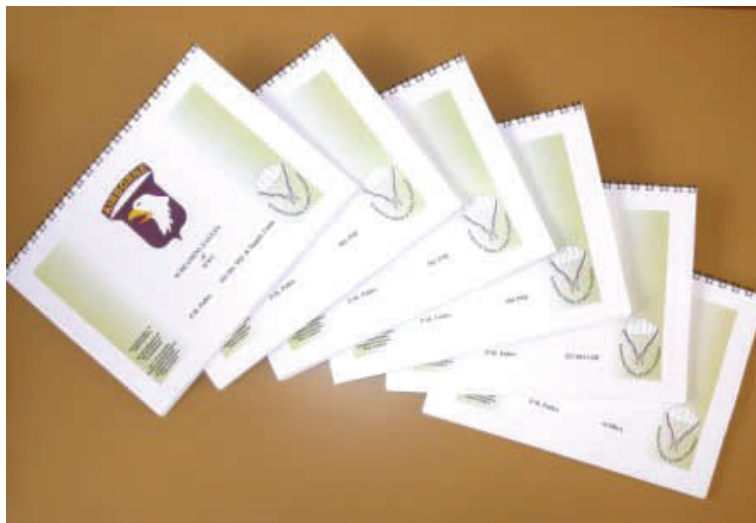
Serie boekjes van P.M Pulles

Op deze pagina bedankt de stichting een aantal mensen die achter de doelen van de stichting staan, en ons helpen het werk mogelijk te maken om zo de 'toorts' door te geven.