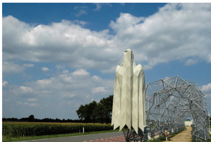
Links de voormalige dropzones tussen Best en Son, rechts het monument met een van de eagles.

Er werd een ontwerp gekozen, maar toen dit ontwerp door de verschillende democratische ingestelde organen om instemming vroeg, was er een groep inwoners van Son die protesteerden. Zij waren namelijk van mening dat het kunstwerk iets moest laten zien van de Amerikaanse 101 e Airborne Divisie die in september 1944 geland waren op de velden waar de A50 ter plaatse uitzicht op geeft. Hun argumenten werden in overweging genomen en een nieuw ontwerp, met 2 prachtige adelaars en een bogenpartij die doet denken aan parachutes die opbollen nadat de parachutist geland is, staat te pronken aan de rand van dropzone Son.