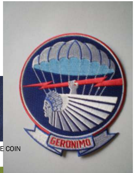
Patch 501 Geronimo WWII afmeting (ong. 15 cm diameter) € 15,00