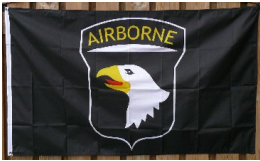
101 ABN vlag € 10,00