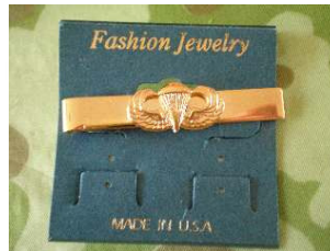
Dasclip met jumpwings € 12,50 (goudkleurig)