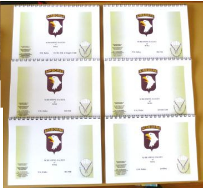
Serie P.M. Pulles boeken € 60,00

Per stuk € 10,00 (HQ, ART, 501, 502, 506 en 327/401)