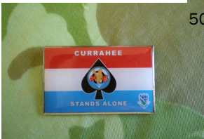
Speld 506 Currahee vlag € 12,50 "Stands Alone"