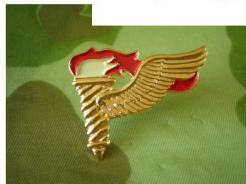
Speld PATHFINDER € 12,50 regulation size