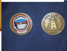
Metalen munt—CHALLENGE COIN Eerde molen/501 € 12,50